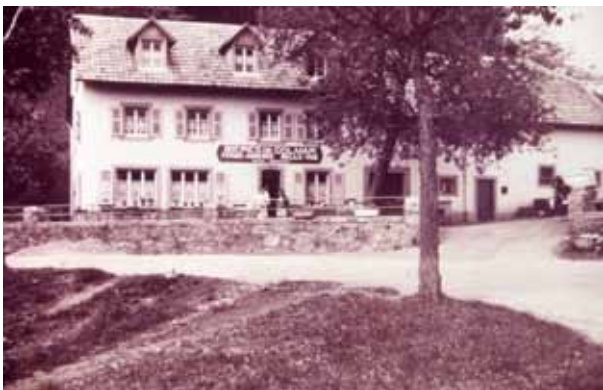
La ferme auberge Belle Vue a brûlé en 1933. C'était le rendez vous dominical des Rombéchats été et hiver pour manger le lard et le pain de seigle et luger sur les pentes aux alentours. Propriété de l'ACE depuis 1958, la maison s'est transformée en colonie de vacances et en résidence d'accueil de groupes « La Longire ».