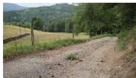
Le chemin de la Vaurière en mauvais état suite aux violents orages de juillet 2010