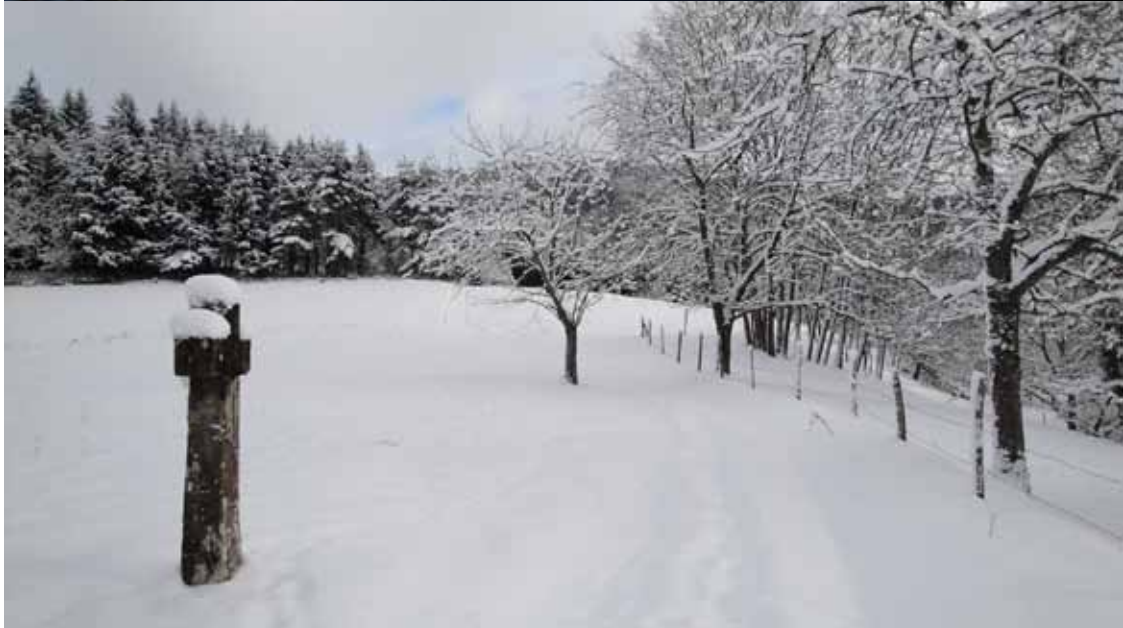
Petit retour en hiver !