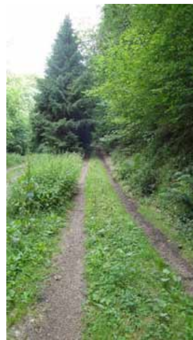
Le chemin de la Grande Goutte en terre

Pour réaliser ces différents investissements qui se chiffrent à 166 500 €, il est attendu 132 800 € de subvention dont 80 000 € concernant la chaufferie bois. Par ailleurs, un emprunt global de 41 600 € est prévu. (31 200 € au budget général et 10 400 € pour le camping).