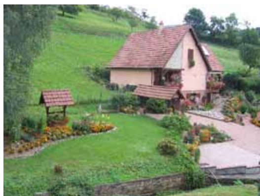
20/20 pour Serge Frantz rue de Pierreusegoutte !

N.B. Pour participer au concours, l'inscription est obligatoire.