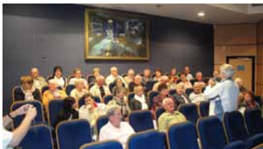
Vision d'un film pour tout savoir sur la fabrication du chocolat

Cette année, les Quatre Routois ont visité le musée du chocolat à la chocolaterie Schaal à Illkirch, l'usine est dirigée par un petit fils Burrus. Après un repas au Mont Ste Odile, nous avons dégusté les bières d'une brasserie artisanale à St Pierre.