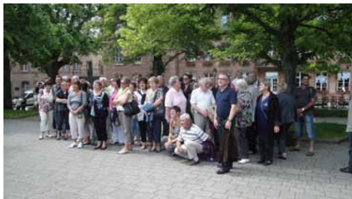
Traditionnelle photo de famille au Mont St Odile