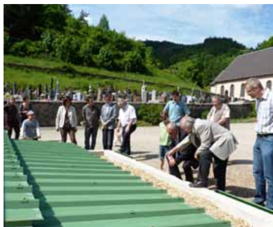
Explication sur le fonctionnement du silo et l'approvisionnement par vis sans fin.