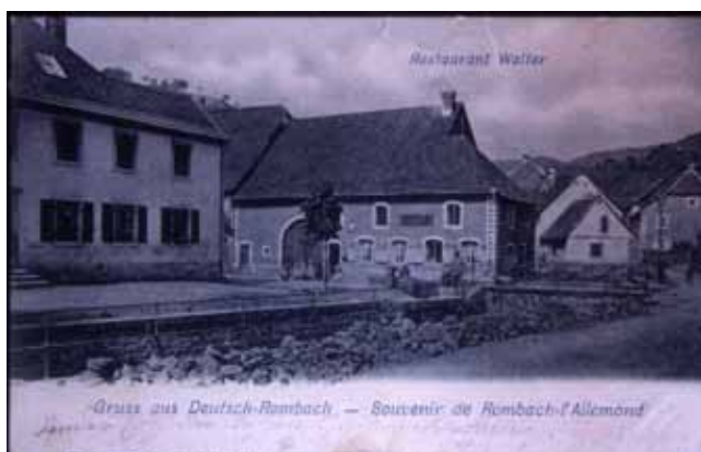
Restaurant Walter avant 1914 et la maison actuelle.