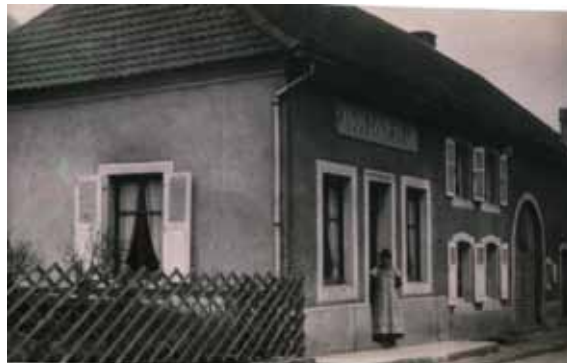
Restaurant Augustin Aubry avant l'incendie