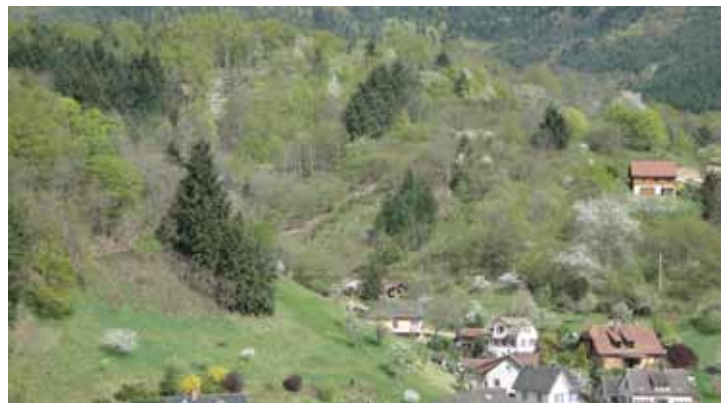
La future zone constructible en prolongement de la rue de la Creuse des Vignes