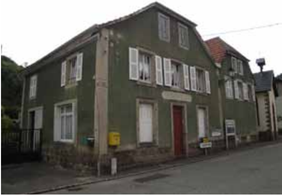
Le Café Central repris par Ernest Lotz en 1933 puis par sa fille Denise au bas du col de Fouchy. C'était quelques soirs la salle d'attente du coiffeur.