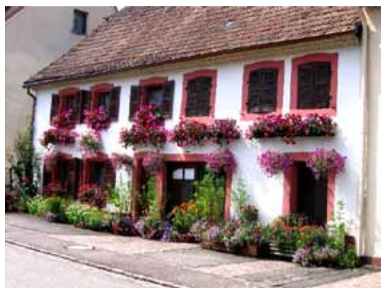
Un prix départemental pour Joseph Roché rue de l'église