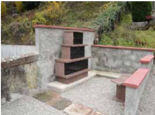
Le columbarium est terminé

La commune de Ste Marie aux Mines est en train de construire un hangar de séchage et de stockage de plaquettes forestières. Une convention est signée entre nos communes afin de valoriser nos ressources énergétiques locales. Sur Rombach, on exploite 3000 m 3 de bois résineux ce qui nous permettra de récupérer environ 300 m 3 de plaquettes forestières.