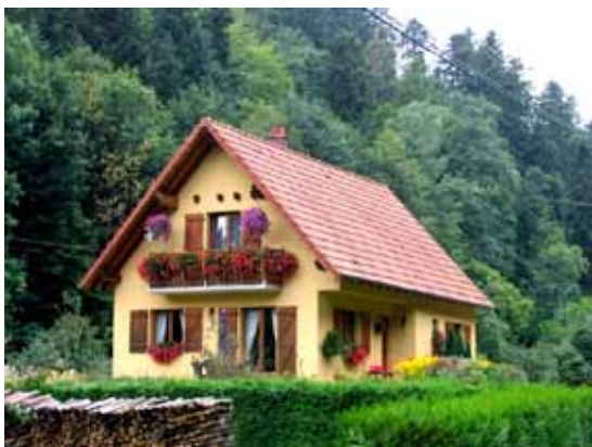
Fleurissements route de la Hingrie