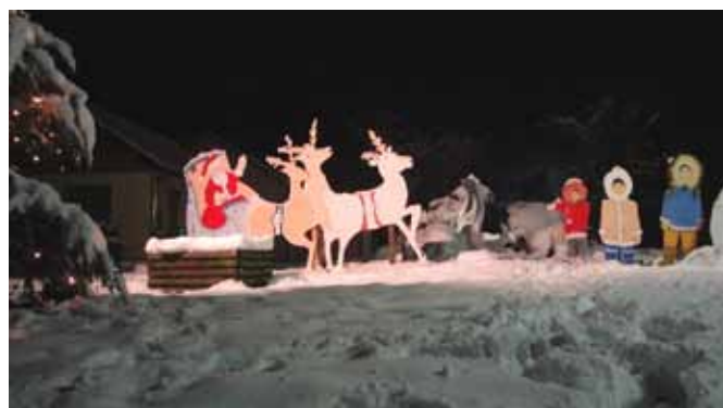
De nouvelles décorations avec l'arrivée du Père Noël dans son traîneau.