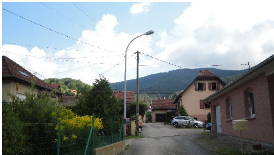
Toile d'araignée rue des Battants