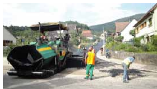
Pose des enrobés rue des Beaux Champs