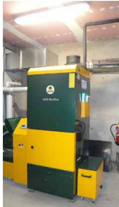
La chaudière bois de 100 KW alimentée par des plaquettes forestières.