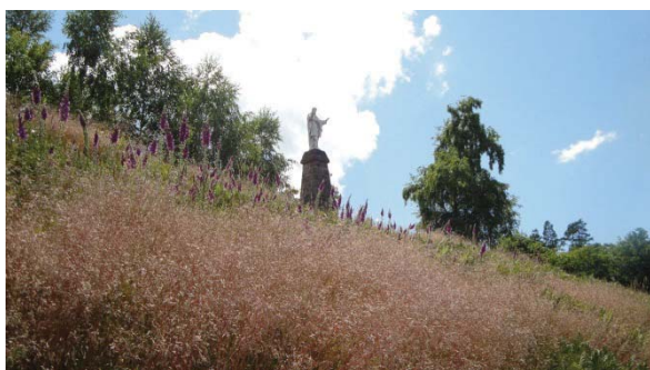
Le sacré cœur à nouveau bien dégagé