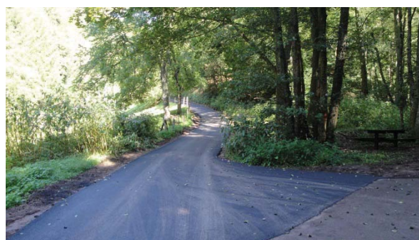
...et du chemin de la Grande Goutte