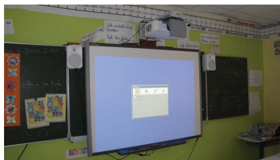
Tableau numérique pour l'école