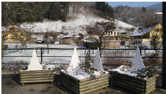
Animation de Noël