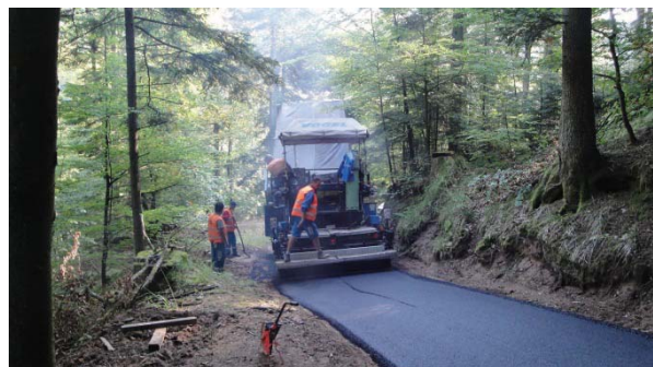
Réfection du chemin de Chat Pendu...

Pour réaliser ces investissements, nous avons bénéficié en 2011 de 84065 € de subvention du département du Haut Rhin, de la région, de l'Ademe et de l'Etat, dont 75685 € concernant la chaufferie bois.