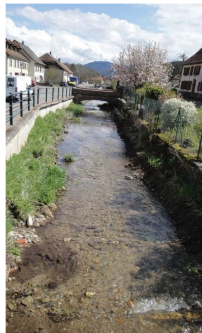
Curage du Rombach au printemps dernier

971 083 de dépenses, tous budgets confondus 997 000 de recettes soit un excédent prévisible de 25 917 avec 151 300 de travaux d'investissement programmés