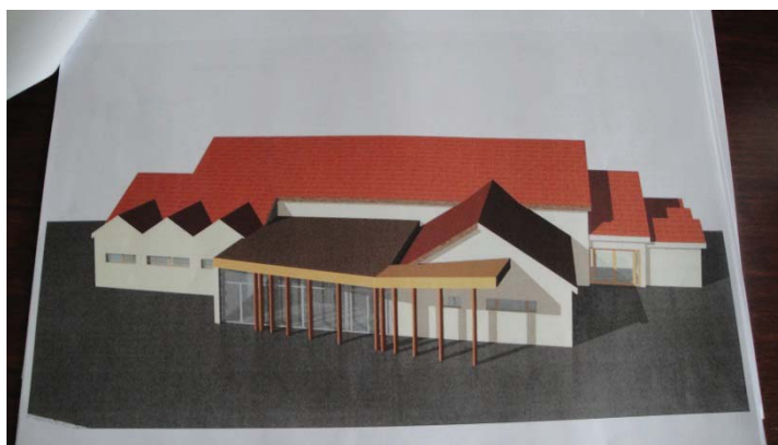
Proposition de nouvel accès pour personnes à mobilité réduites à l'espace R Hestin.