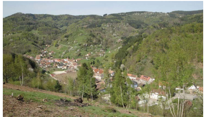
Vue du Sacré Cœur à nouveau dégagée sur le village

Les réalisations en dépenses de fonctionnement s'élèvent à un montant de 536860.09 € et les recettes de fonctionnement s'élèvent à un montant de 671075.90 €; comme suit dans les principaux postes.