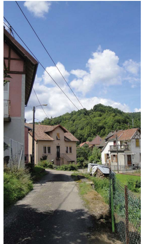
Rue de la Biaisé avant les travaux