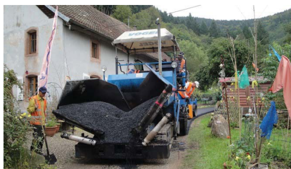
Pose d'enrobés chemin de la Vaurière