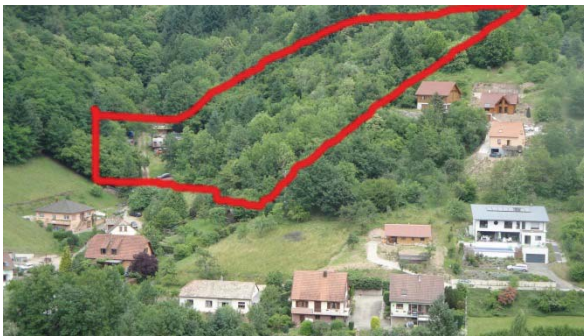
Le périmètre de l'AFUa Gérard Goutelle en rouge