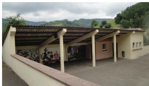
Réfection de la toiture du préau de la cour d'école

Pour réaliser ces différents investissements qui se chiffrent à 151 300 €, il est attendu 54 900 € de subvention. Par ailleurs, un emprunt global de 30 615 € est prévu (29 800 € au budget général et 815 € pour le camping).