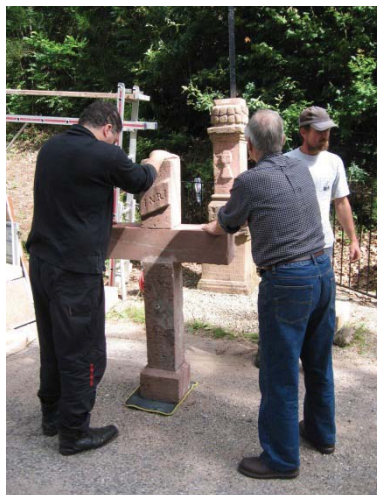
Préparation de la croix réparée