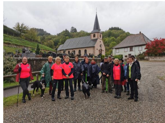
Rando Rose 1 er octobre 2022