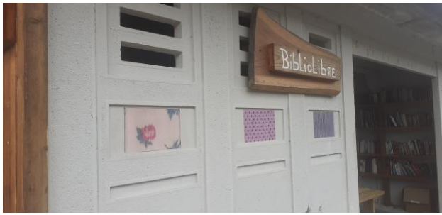
Collage de reproductions d'échantillons sur les murs du bibliolibre.