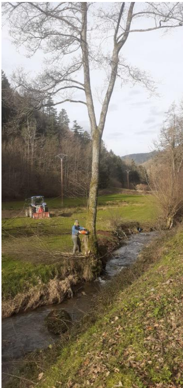
Abattage des arbres morts le long du Rombach dans le vallon de la Hingrie