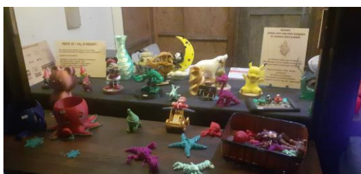
Motif de Noël en impression 3D de M Schneider