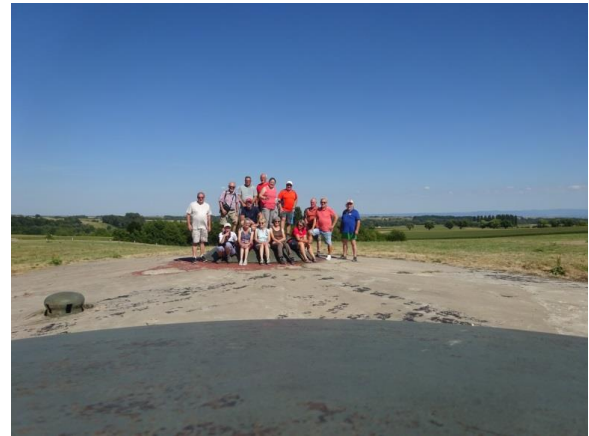
Fort de Schoennenbourg 3 août 2022