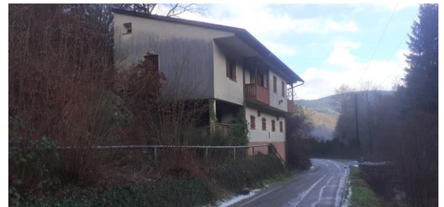
Acquisition des bâtiments « AURORA » pour 20 000 € en vue de création d'un gîte familial et d'une salle festive.