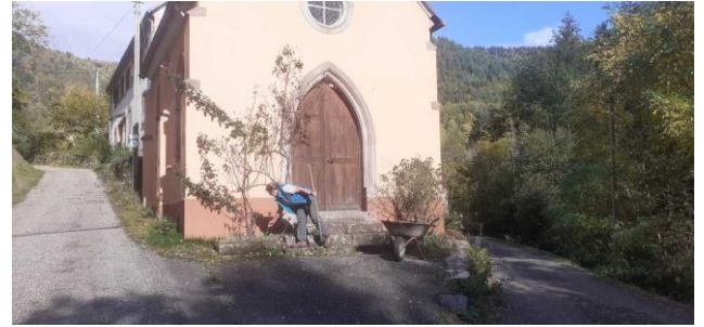
Voisine Bénévole au travail devant la chapelle de la Hingrie