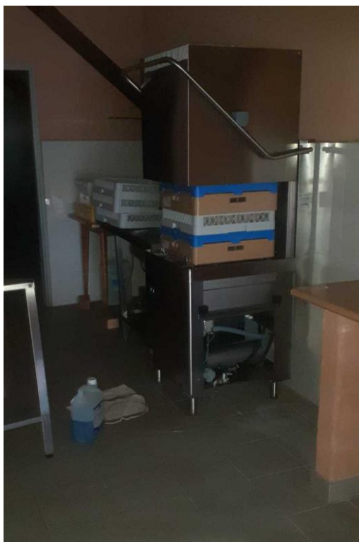
Rénovation du sol et mise en place d'un lave-vaisselle