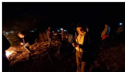
Marche aux flambeaux et Bûre 23 mars

Le Club vosgien Lièpvre/Rombach-le-Franc organisera, cet été, plusieurs randonnées sur le massif des Vosges et en Forêt-Noire qui seront annoncées dans nos colonnes.