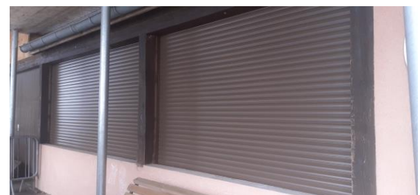
Mise en place de volets roulants