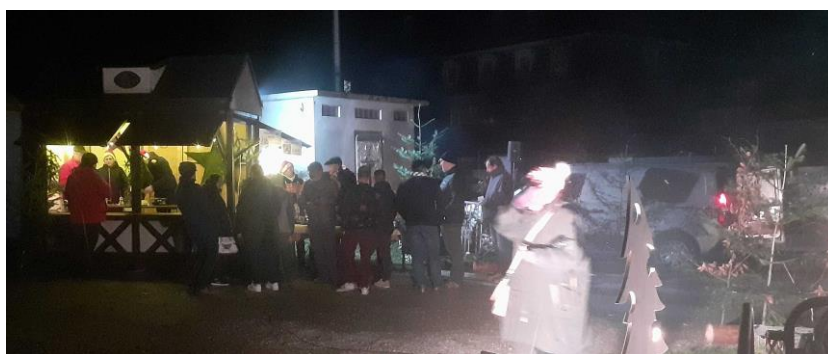
Autour des grillades et boissons chaudes !