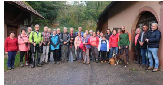
Randonnée du vin nouveau 16 octobre 2022