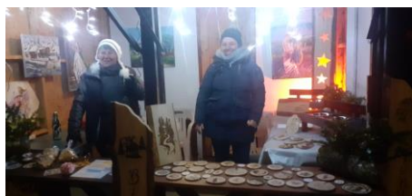
L'association « Image »