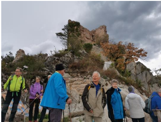
Randonnée châteaux de Scherwiller 18 septembre 2022