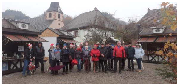
Départ de la marche du téléthon