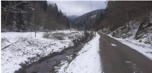
Entretien de la ripisylve par un agriculteur local. Le vallon de la Hingrie semble s'élargir ! L'entretien des berges est à la charge des propriétaires. Actuellement, un champignon frappe principalement les frênes qui dépérissent et deviennent dangereux pour les usagers de la route.