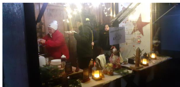
L'association St Martin en Val d'Argent