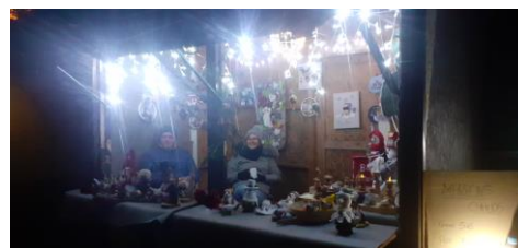
Décorations de Noël de la famille Legrand