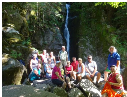
Randonnée Défilé de Straiture – Scierie du Lançoir – Cascade du Rudlin 19 juillet