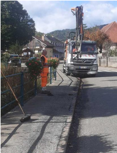
Réfection par gravillonnage du trottoir le long du Rombach associatives réalisés pour 25 000 €

Peu de travaux réalisés cette année. La Collectivité européenne d'Alsace (CEA) vient de mettre en place un dispositif de soutien financier aux communes qui intègre les réfections des voiries communales. Celles-ci n'étaient plus subventionnées auparavant. Dans ce cadre un plan de rénovation de voiries sera mise en place pour le budget 2023.