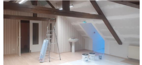
Réfection et isolation d'une salle de classe pour 27 000 €

L'acquisition de l'ensemble AURORA vient d'être concrétisée courant décembre dernier. Un projet d'aménagement sera élaboré au courant de cette année. Il est prévu d'y réaliser un gîte familial et une salle festive.